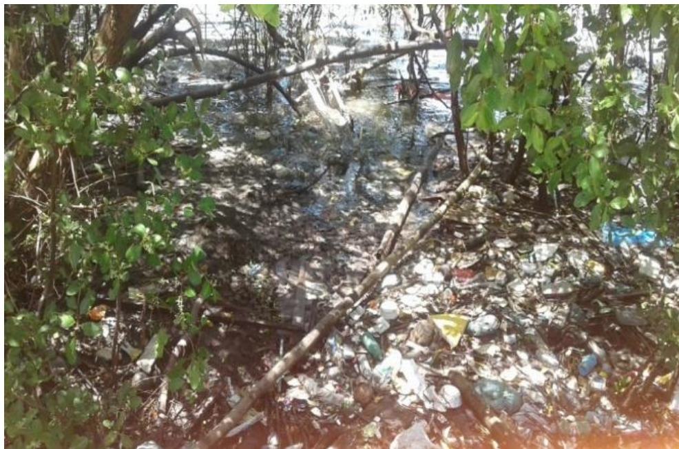
Figura 02: Ponto 1 - Em frente ao EREM Ginásio Pernambucano.

As fotos a seguir, tiradas ao longo da área escolhida para a produção do presente artigo, tecem um preocupante cenário de degradação ambiental. Garrafas pet e de vidro, sacolas plásticas, latinhas de cerveja e refrigerante, etc., amontoam-se, pintando um quadro que, em certa medida, assemelha-se a um lixão.