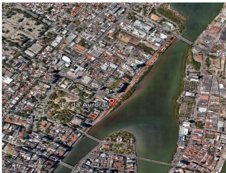
Figura 01: Identificação da Área de Estudo. Trecho do Bairro de Santo Amaro.

Como mostra a imagem abaixo, os lócus do trabalho (local escolhido para realização da pesquisa) estendem-se na área mangue compreendida entre duas pontes da Rua da Aurora, a Ponte Princesa Isabel e a Ponte do Limoeiro, no bairro de Santo Amaro, em Recife-PE.