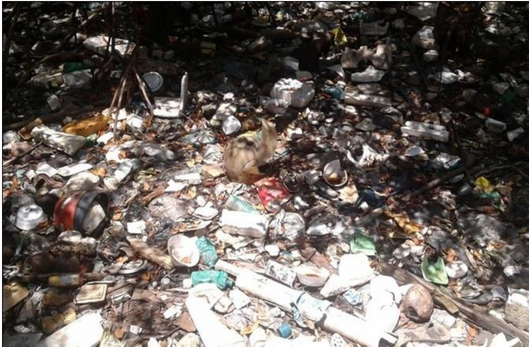
Figura 03: Ponto 2 – Em frente ao SEPLAG/PE (Secretaria de Planejamento e Gestão).